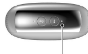
Dioda ukazuje stav nabití

× Během nabíjení nejsou dostupné všechny funkce.